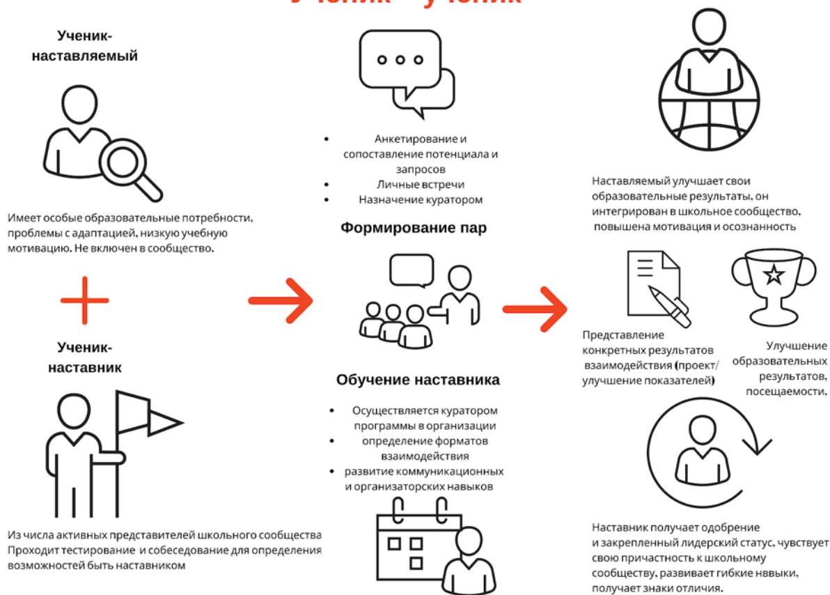
Рисунок 1. Графическое представление реализации программы наставничества по форме «ученик – ученик».