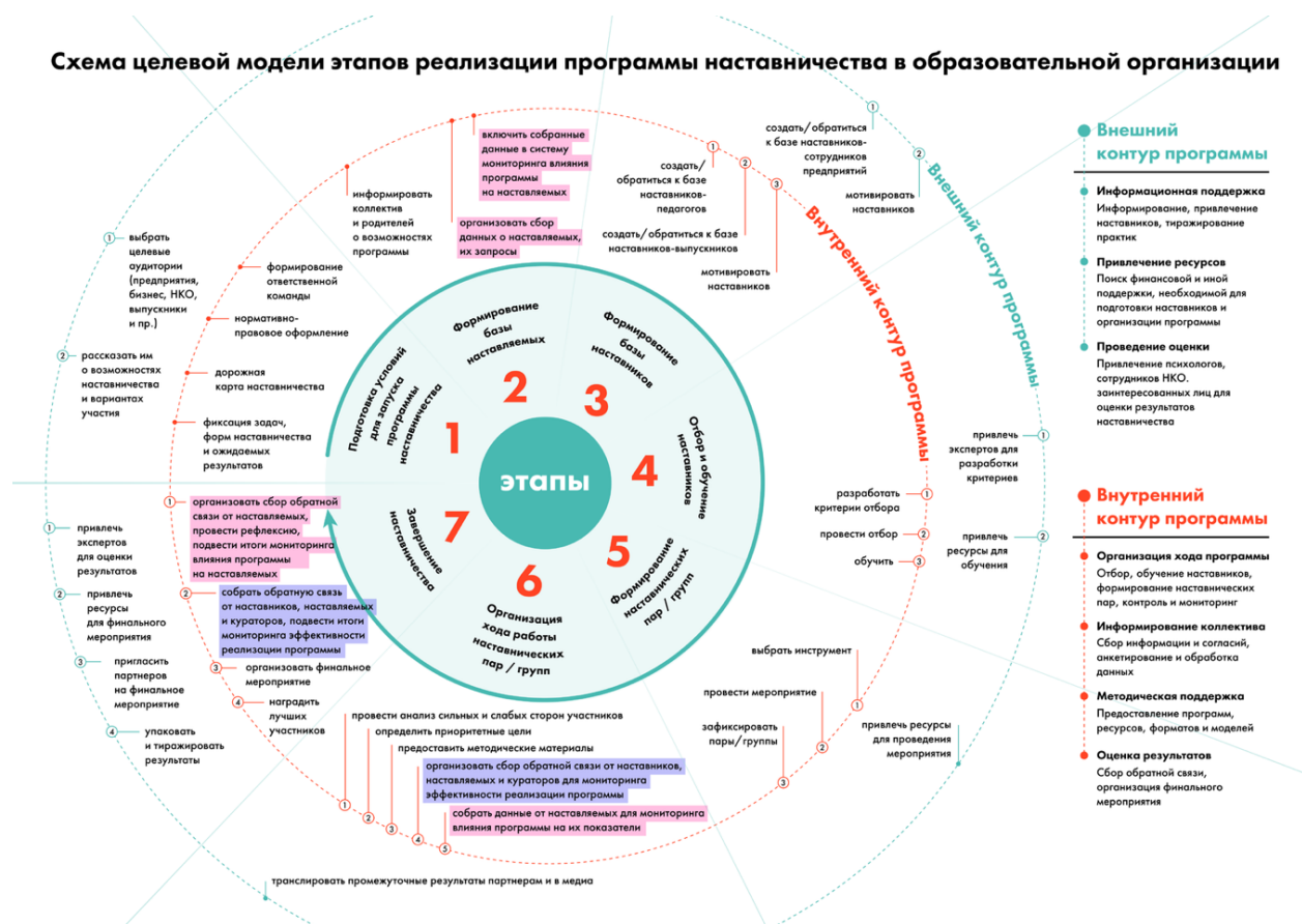
Рис. 6. Схема целевой модели этапов реализации программы в образовательной организации

Содержание каждого этапа, представленное в виде направлений работы с внутренним и внешним контурами, содержится в таблице 1 «Целевая модель этапов реализации программы наставничества в образовательной организации». В таблице 2 «Целевая модель программы наставничества в образовательной организации» представлены основные компоненты программы наставничества.