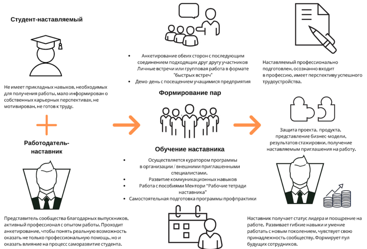
Рисунок 5. Графическое представление реализации программы наставничества по форме «работодатель – студент».