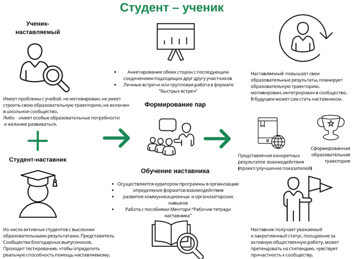
Рисунок 3. Графическое представление реализации программы наставничества по форме «студент – ученик».